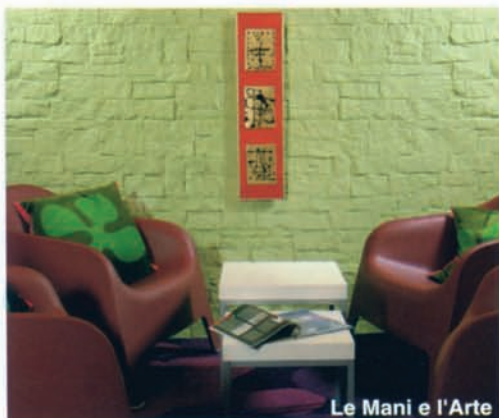
Le Mani e l'Arte

Grazie alla sapiente tecnica di lavorazione di Le Mani e l'Arte, pietre, polvere di marmi, sabbie silicee, granulati di granito si agglomerano e si trasformano in pannelli decorativi, cornicioni, capitelli, bassorilievi. I manufatti hanno una eccellente resistenza termica che li rende utilizzabili anche all'esterno. L'esclusivo sistema modulare a incastro dal peso estremamente contenuto consente la posa in opera dei manufatti con facilità e notevole risparmio in termini di costo di manodopera. Un perfetto assemblaggio tra i vari pannelli, infatti, permette di limitare il lavoro della posa a un semplice ritocco sulle giunzioni, grazie agli stucchi realizzati con gli stessi materiali di produzione.